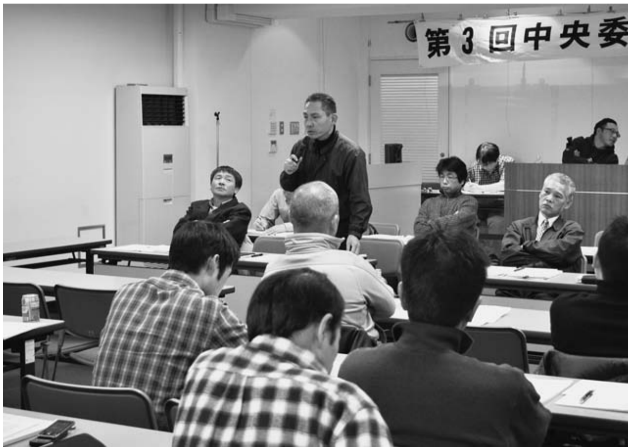
経過報告をする染書記長

第3回中央委員会が開催され、「賃金確定総括(案)」「統一自治体選方針」「交付金の暫定処置」等の議案が提案され、確認されました。