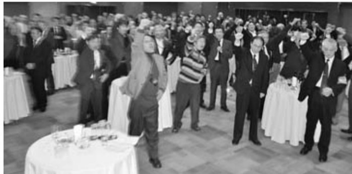
最後は青年部長の音頭で全体で「団結がんばろう！」