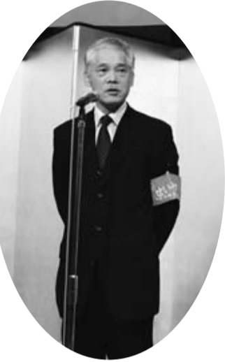
青年部長 団結ガンパロウの前の挨拶