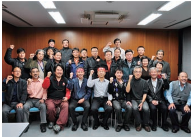
SKプラザでの日韓交流会