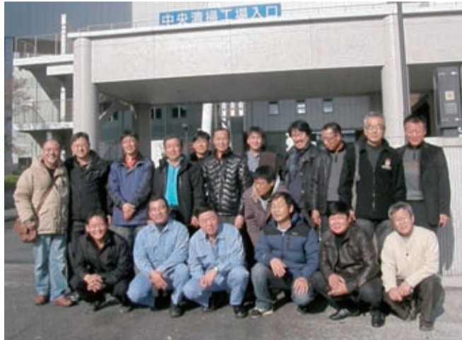
中央工場前 作業着の2人が収集作業をする