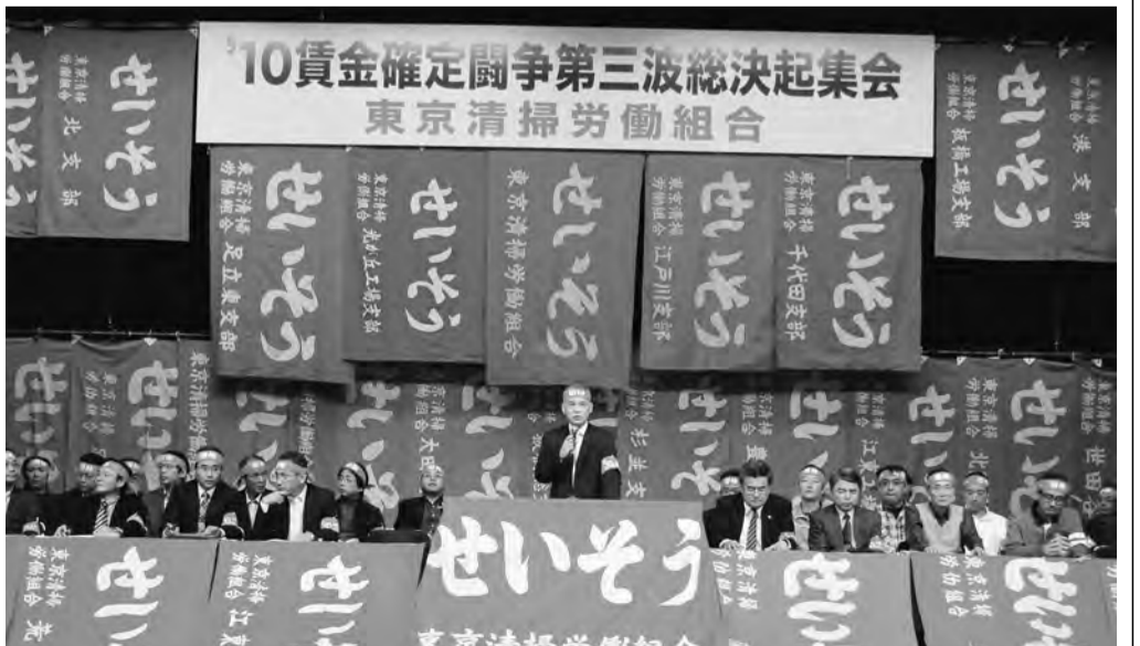
11月17日 第三波決起集会

区長会最終提案の内容と評価 (1) 11月19日に開催された第4回団体交渉で、区長会側は勧告の扱いについて、「民間給与の厳しい状況が職員給与に正確に反映されたものとして、重く受け止めております」とし、業務職給料表の改定について、正式な交渉の場での今後の協議を担保させる。特別昇格制度の廃止に代わる制度の確立を含めた人事・給与制度の改善を求める。具体的要求として、i) 技能長補佐職の新設、ii) 特別昇格資格基準の緩和、iii) 全級における昇格率の改善、iv) 08年安給設置基準の改善の再確認、などを重点課題として追求を図ることとした。区長会は、勧告で示された一時金の勤続手当からの削減について、12月支給分の引下げで対応すべき」と要求の中心とした現業系人