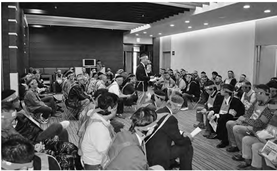
11月16日 区政会館座り込み

(1めんより) 告が実施されれば職員の年間平均給与は、約10万8千円(△1・6%)の減額という厳しい内容であった。10月12日の勧告後の区長会に対する要請、団体交渉、専門委員会などで勧告の問題点や不当性について指摘をし、勧告の扱いについては、誠意ある労使協議で対応するように求めて来たが、区長会は「依然として厳しい民間給与の状況が、職員給与に反映された結果として重く受け止めており、勧告の内容を実施する方向で検討を行っている」とし、業務職給料表についても「勧告給料表の改定内容に準じた検討を進めております」という回答を繰り返すばかりであった。