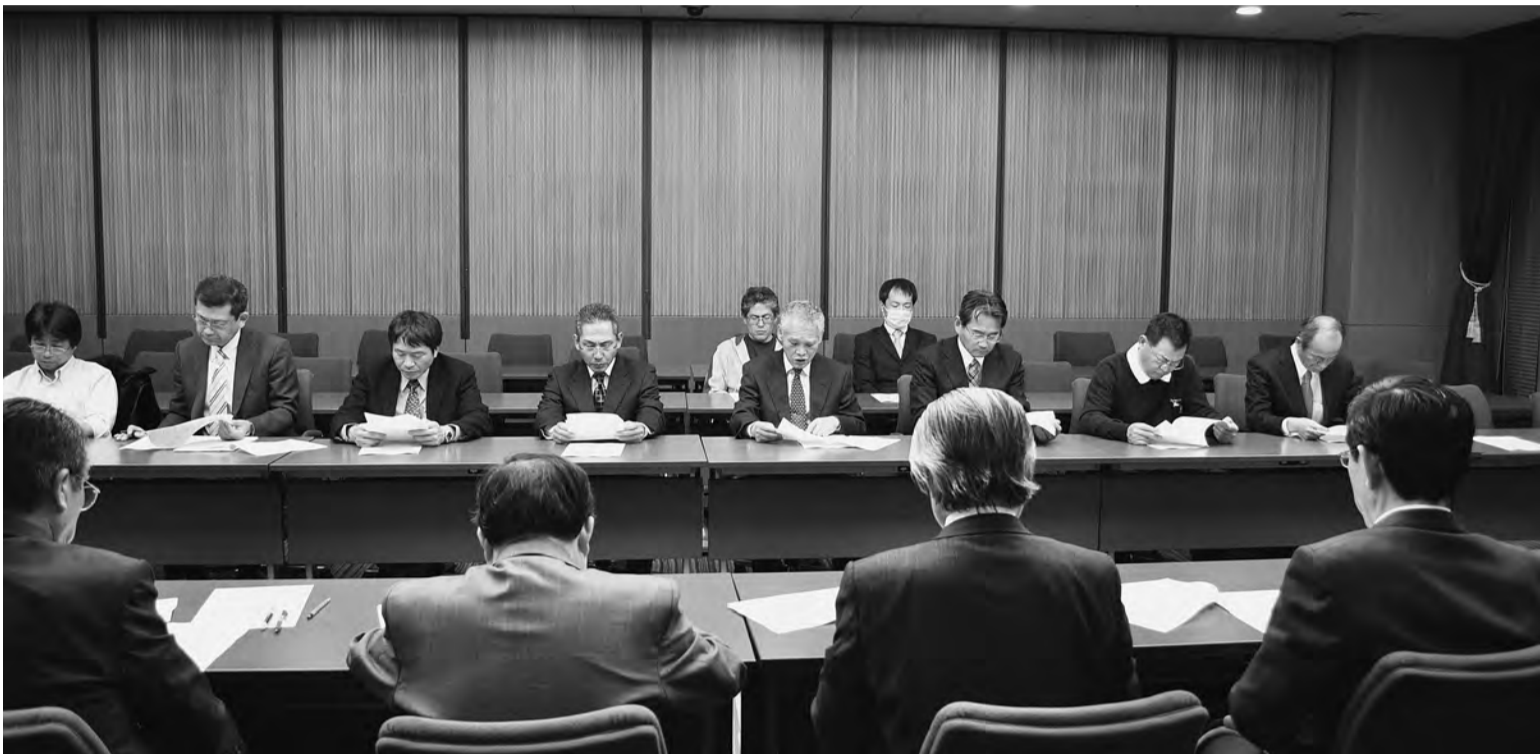
11月19日未明 最終団交

10月12日の特別区人事委員会勧告を受け、区長会要請、区長会会長要請、各区長要請、座り込み行動や地連別も含め3波にわたる決起集会等の大衆行動を展開しながら、11月19日までに5回の専門委員会交渉、小委員会交渉、団体交渉を積み上げてきました。今次確定闘争は人事委員会勧告の①月例給の0・30%（平均1,259円）引下げ、一時金の4・15ヶ月から0・2ヶ月分引下げの3・95ヶ月の改悪②地域手当を現行の17%から本則18%に引き上げと併せ、同率程度の給与月額引下げという極めて不当な内容でした。 またわが組合が要求した技能長等人事任用制度の諸要求と来年度級格付け制度が廃止になる中、新たな制度の要求や昨年の「保障額表」から「業務職給料表」への切り替えのなかで生じた問題点の解消等の給与制度改善が争点でした。 結果的に月例給、一時金は勧告とおりの2年連続の引下げになり、まさに苦渋の判断となりました。また人事任用制度・給与制度の諸要求に対してもわが組合の要求に応えない、大変不満な内容でしたが、今後の課題として区長会当局が団交のなかで認め、誠実に協議することを確認することが出来ました。 来年度以降「公務員制度改革」等の新たな要因が加わることが予想され、闘いは引き続き困難な状況の中ですが、次年度の要求実現に向け、組織を強化し、闘いを進めよう！