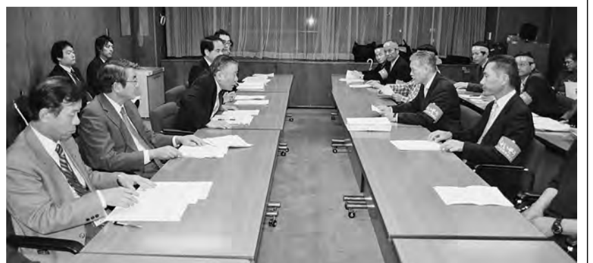
11月17日 区長会会長要請

権制約の代償措置である人事院勧告制度は尊重すべき」とする意見の一方で、「現下の厳しい経済社会情勢、財政状況を踏まえれば、公務員給与については厳しい姿勢で臨むべき」と勧告以上の引き下げ（深掘り）を目指すべきとする意見も出され、この日の会議では引き続き検討となった。 公務員連絡会は、中央行動を背景としながら総務省交渉を強化、11月1日の第2回給与関係係会議、その後の臨時閣議で、本年の国家公務員の給与改定については人事院勧告通り実施する方針が決定され、国会審議が始まった。しかし、11日の総務委員会質疑の中でも「公務員総人件費2割削減」の議論に終始し、一部野党からは一般給与法改正法案に対する修正案が提出されるなど、国の動きも予断を許さない状況にある。