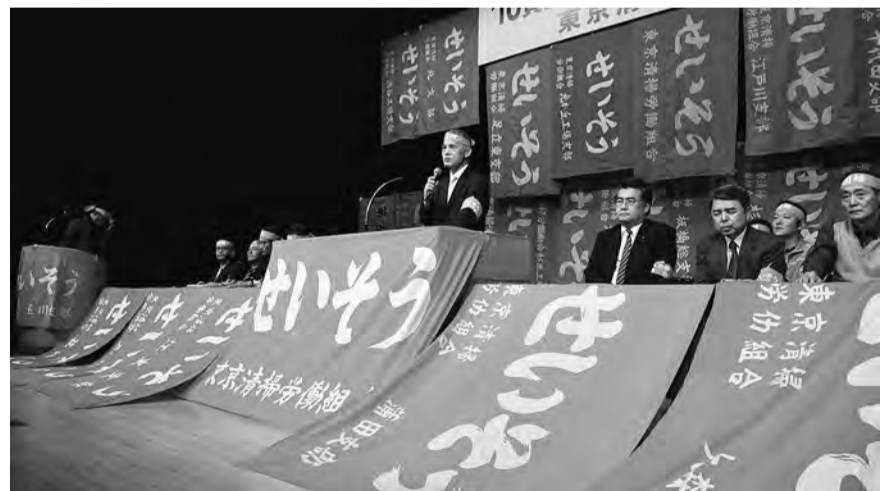
11月17日 第三波決起集会