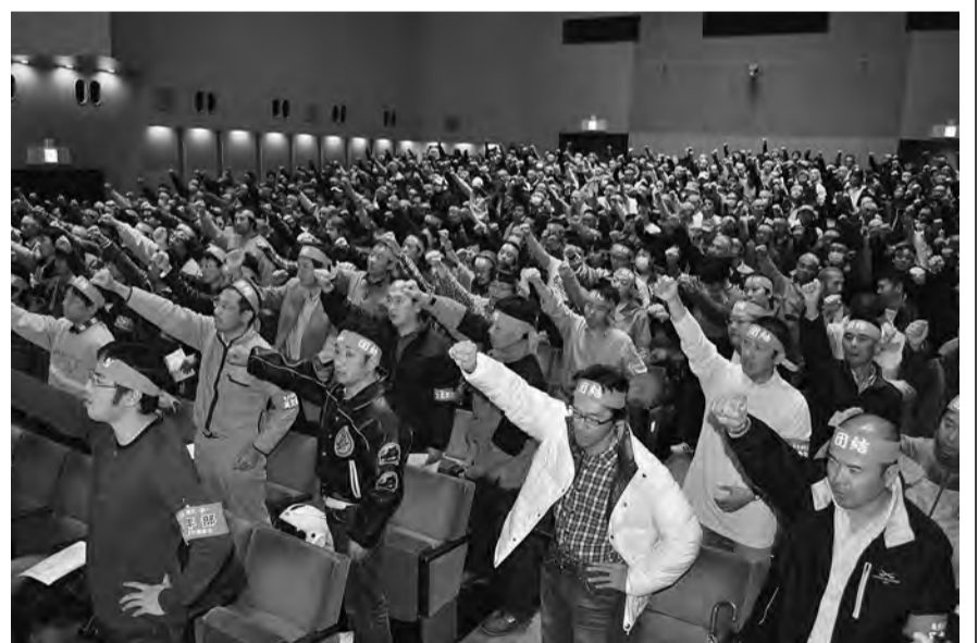
11月17日 第三波決起集会（団結ガンパロウ）

公務員、とりわけ現業系職員を取り巻く情勢は依然として厳しいが、公務員法第57条で「単純労働」と位置付けられている現業職員の法的な位置付けについても見直しの議論が始まっている。区政の第一線で働く清掃労働者として、公務・公共サービスを守る気概で労働条件の改善や職場闘争の前進に向けて、全組合員が東京清掃労働組合に結集を図り、力強くこれからの闘いを進めなければならない。各地連ごとの役員区長への要請や各区長への要請、総決起集会への多くの組合員の結集、署名行動やステッカー闘争など、職場からの闘いを積み上げた全組合員に対し、中央執行委員会として心から敬意を表するものである。