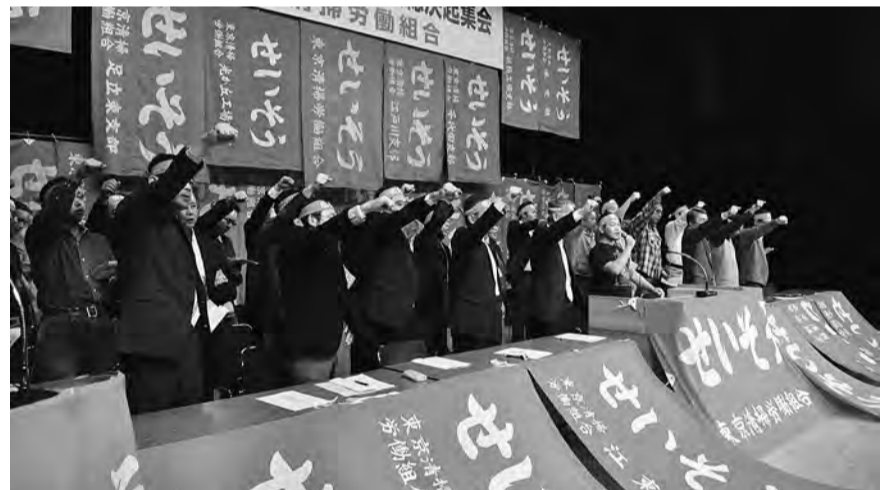
11月17日 第三波決起集会(シュプレヒコール)