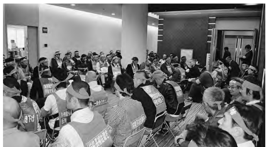
11月16日 区政会館座り込み