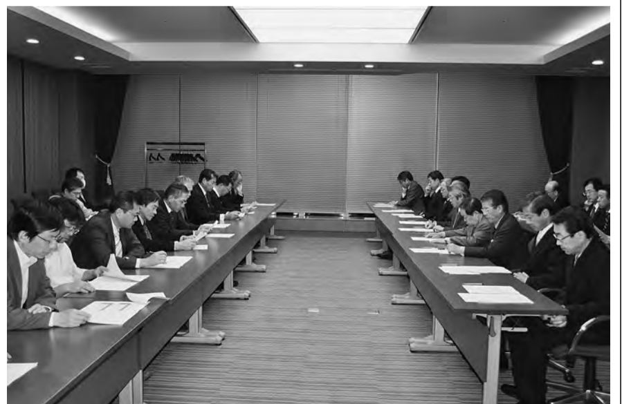
11月19日未明 最終団交