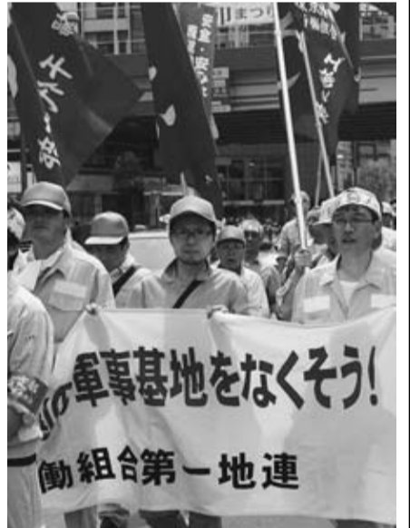
軍事基地をなくそう！第1地連