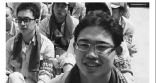
笑顔で元気の青年部