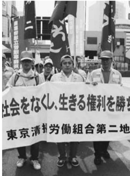
格差社会の是正を！第2地連