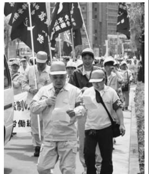
元気なコールで！第5地連

連絡19号でお知らせしたサッカー大会が2月1日から4月15日の4日間、16チームが参加して実施されました。参加チームは以前の半分ぐらになり、近な仲間があつまり、にぎやかな大会になりました。