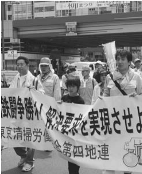
国鉄闘争勝利！第4地連