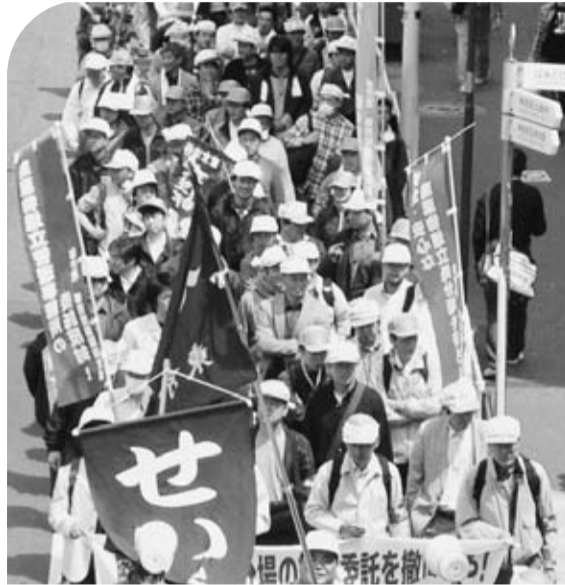
集会終了後、代々木公園までデモ行進