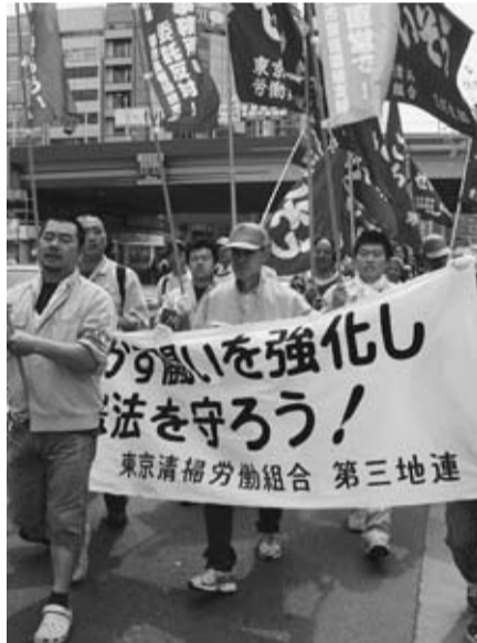
憲法を守ろう！第3地連