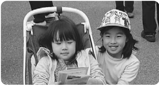
がんばれ！おとうさん