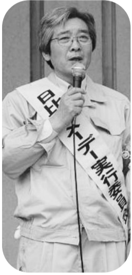
集会議長の金澤副委員長