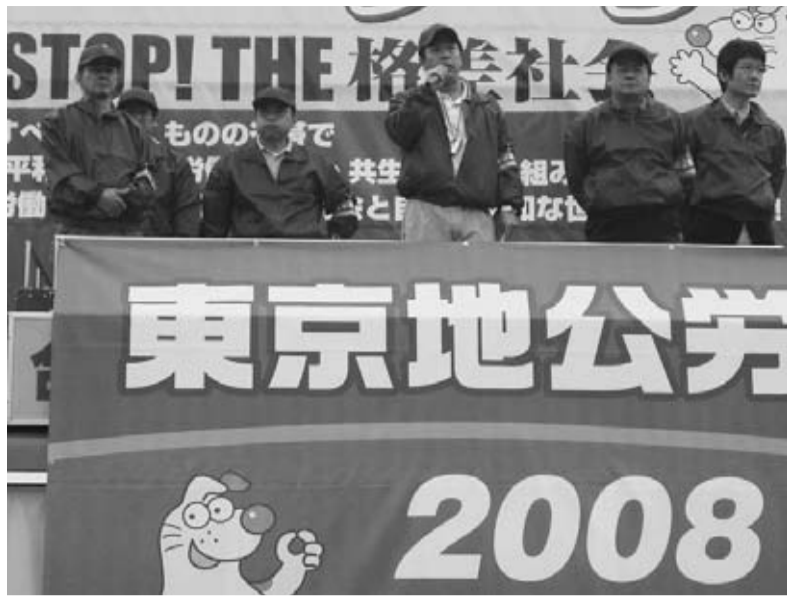
東京地公労の独自集会：明治公園