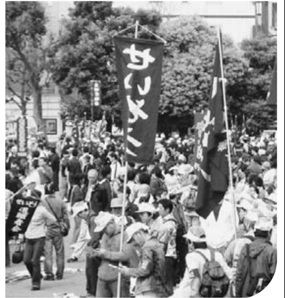
明治公園に結集したわが組合